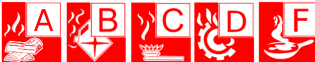
Kuva 1: Käsisammuttimien teholuokat kertovat, minkä tyyppisiä paloja sammuttimella voi sammuttaa.