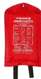
Kuva 7: Sammutuspeite