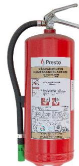
Kuva 4: Nestesammutin

Sammutuspeite sopii pienten palonalkujen ja ihmisten päällä olevien vaatteiden sammuttamiseen tukahduttamalla. Suositeltava koko on vähintään 180 x 120 cm.