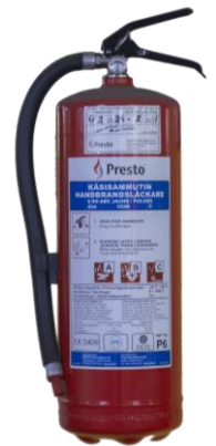
Kuva 3: Jauhesammutin

Jauhesammutin on hyvä yleissammutin lähes kaikkiin paloihin. Huonona puolena voidaan pitää sammutusaineen liikaavuutta; hienojakoinen pöly voi aiheuttaa esim. sähkölaitteille suurta vahinkoa. Likaavuuden vuoksi jauhesammutinta ei suositella tiloihin, joihin voi kohdistua ilkivaltaa.