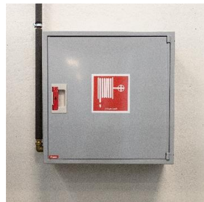
Kuva 2: Pikapaloposti

Pikapalopostit kuuluvat sekä rakennukseen kiinteästi asennettaviin sammutuslaitteisiin että alkusammutuskalustoon. Veden sammutusvaikutus on pääasiassa jäähdyttävä, mutta vesihöyry myös tukahduttaa paloa tehokkaasti. Vesi ei sovellu rasvapaloihin tai palavien nesteiden sammuttamiseen. Vesi myös johtaa sähköä, joten jännitteelliset kohteet on tehtävä virrattomiksi ennen vedellä sammuttamista.