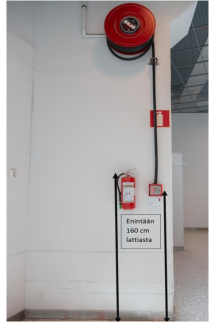
Kuva 9: Sammuttimen kahvan ja pikapalopostin letkun pään sijoitus lattiapinnasta

Myös pikapalopostin sijoituskorkeudessa on huomioitava, että letkun saa helposti lattiatasosta käyttöön. Pikapalopostikaappi sijoitetaan siten, että kaapin alareuna on enintään 120 cm korkeudella lattiapinnasta. Ylemmäs sijoitettavan pikapalopostikelan alas laskeutuvan letkun pää tulee sijoittaa enintään 160 cm korkeudelle lattiapinnasta.