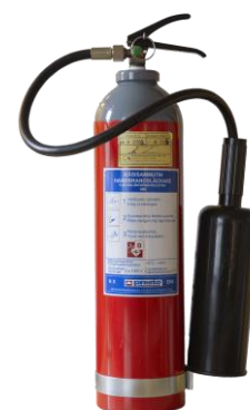
Kuva 5: Hiilidioksidisammutin