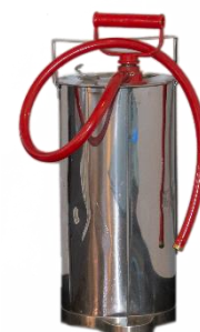
Kuva 6: Sankoruisku